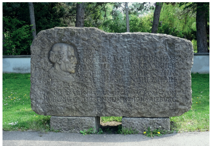
Paracelsus 1964-ben egy plasztikával díszített emlékművet kapott Bécsben, a belvárostól északkeletre, a Duna szigetén lévő Donauparkban

Ezután egyetemjárásba kezdett: 1510 táján Bécs, Wittenberg, Lipcse, Erfurt és Ferrara egyetemén fordult meg. Bizonytalan, hogy a mesterfokozaton kívül szerzett-e más titulust, mindenestre önmagát orvosnak tartotta. Egy ideig a velencei seregben működött, majd Habsburg V. Károly regimentjében szolgált mint katonaoorvos. Itt személyes tapasztalatokat szerzett a sebgyógyítás terén, nem visolygott a betegekkel való közvetlen kontaktustól, és a hagyományos orvoslás kérelhetetlen kritikusává vált. Egy ideig a bázeli egyetemen tanított (1527/1528). Innét polémiára hajlamos és nyers természete miatt kellett távoznia. Élete során bejárta szinte teljes Nyugat-Európát, azonkívül Rodoszon, Cipruson, Isztambulban, a Szentföldön és Egyiptomban is töltött némi időt.