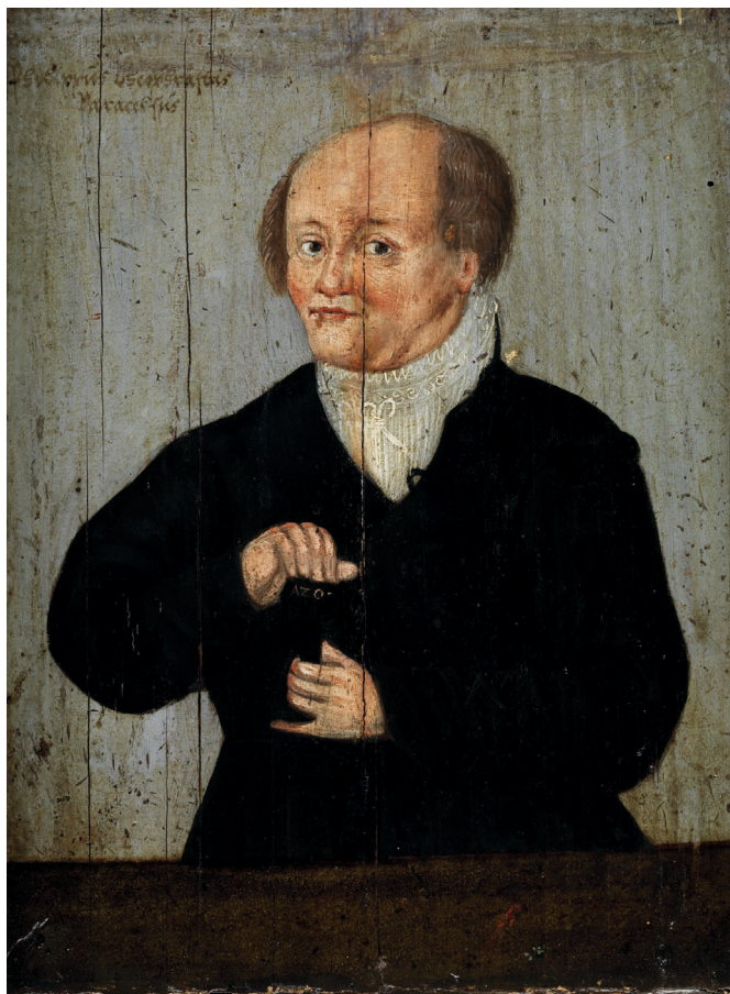
Paracelsus egy feltehetően Augustin Hirschvogel 1540. évi metszete alapján készült olajfestményen

riusokkal való viszonya megromlásához. Például a megfelelő dózisban adagolt higany segítségével sikereket ért el a vérbaj gyógyítása terén, viszont szembekerült a már említett nagy hatalmú Fuggerekkel, ugyanis az általuk Amerikából importált guajakfa kérgéből főzött tinktúrát is szifiliszellenes szerként forgalmazták. Paracelsus a szennyezésmentes hatóanyag előállításával összefüggésben a laboratóriumi gyakorlatot is az orvosi munka fontos részének vélte.