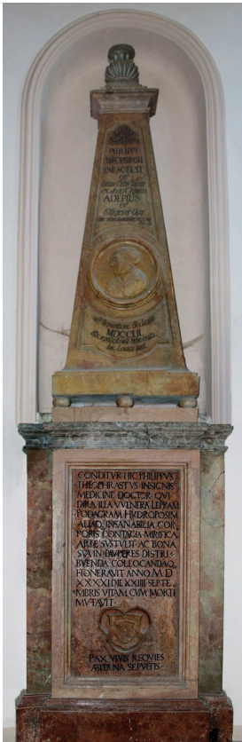
Paracelsus síremléke a salzburgi Szent Sebestyén-templomban