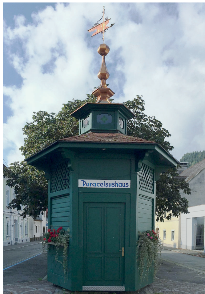
A Bad Sankt Leonhardban álló Paracelsus-ház egy Lavant-völgyi forrástúra kiindulópontja

Paracelsus 1524-ben Villachba látogatott, majd halála előtt két évre, 1538 és 1540 között ismét hazatért gyerekkori otthonába. Villach város 1538. május 12-i oklevele bizonyítja ezt, amelynek tárgya Paracelsus apjának elhunytja és az örökösödés. 1538 au-