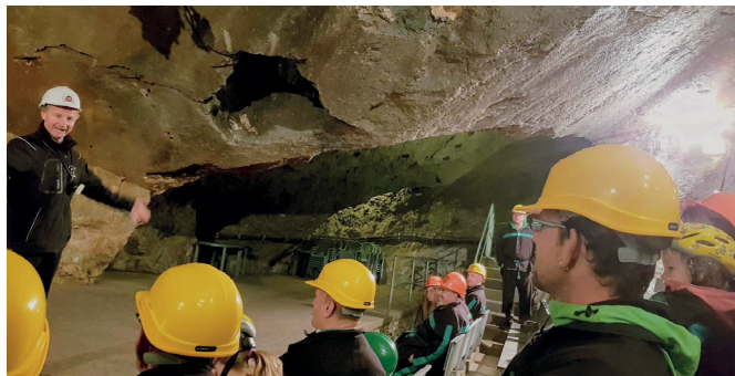
Májustól októberig látogatható a Bad Bleiberg határában lévő Terra Mystica és Terra Montana bányászati kiállítás („élménybánya”). Előbbi geológiai jellegű, utóbbi a bányászok munkájára koncentrál. Paracelsus személyével a Terra Mystica foglalkozik