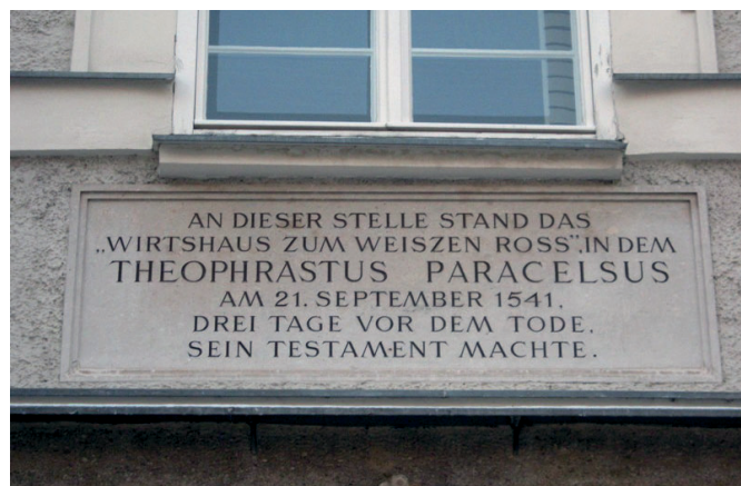
Paracelsus 1541. szeptember 21-én a salzburgi Fehér ló fogadóban (helyén ma a Kaigasse 8. sz. ház áll) diktálta végrendeletét