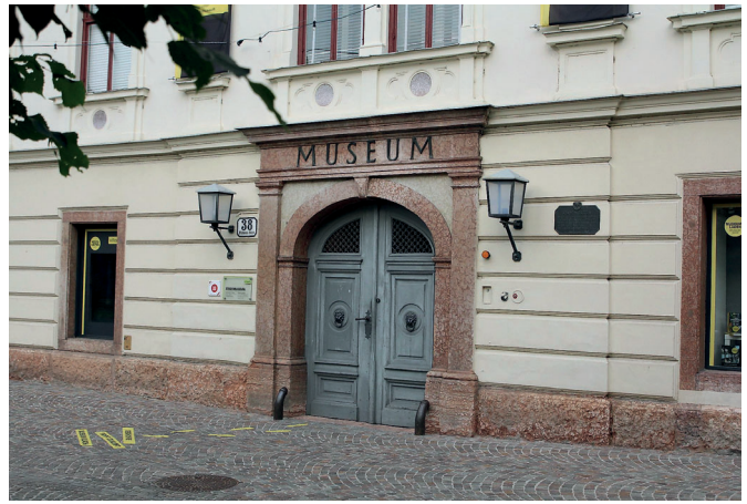
A villachi városi múzeum földszintjén két terem állít emléket a 16. századi orvos-polihisztnak

A későbbi jatrokémikus Einsiedelnben, Schwytz kantonban (a mai Svájc területén) született ismeretlen anyától és egy Wilhelm Bombastus von Hohenheim nevű nemesembertől. Saját visszaemlékezése szerint szerény körülmények között nevelkedett. Körülbelül tízéves korában Villachba került, ahol apja tanítóként dolgozott. Paracelsus első bányászati, ásványtani és botanikai ismereteit feltehetően apjának köszönhette. A 16. században több karintiai bánya a korabeli Európa bányászatának, fémkereskedelmének jelentős részét magához vonó Fugger család érdekeltiségébe tartozott, például a Villach közvetlen közelében fekvő Bad