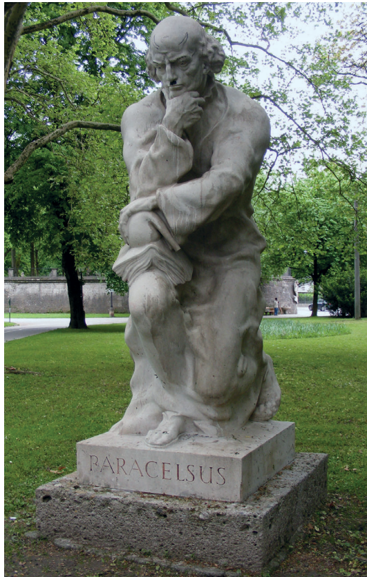
Paracelsus salzburgi szobra Josef Thorak alkotása (1943). 1952-től áll jelenlegi helyén, a Mirabell-park közelében