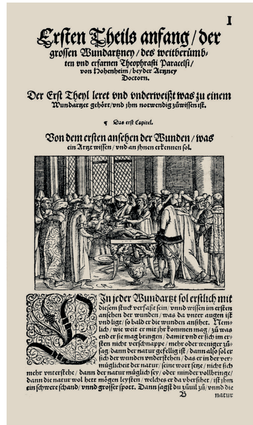
Az 1565-ben Frankfurtban megjelent Opus chirurgicum első oldala

gusztszásban és 1540 márciusában is igazolhatóan Karintiában tartózkodott. Megvizsgálta a Lavant folyó völgyében fakadó savanyú vizek gyógyhatását. Ennek a munkásságának több forrásház állít emléket, ilyeneket például Bad Sankt Leonhard térségében láthatunk, ha letérünk a Grazot Klagenfurttal összekötő autópályáról.