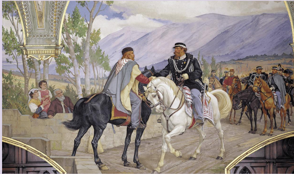
GARIBALDI és II. VE találkozója (PIETRO ALDI freskója, 1886)

Velence } BISMARCK győzelmei kapcsán Róma } kerülnek Olaszo.-hoz 1866-ban, ill. 1870-ben