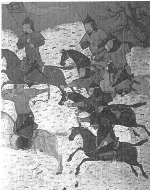
Mongol harcosok középkori ábrázolása

A tatárjárást követő újjáépítésről nem kell írnia. Használja a középiskolai történelmi atlaszt!