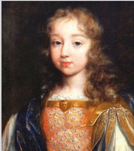
XIV. L. nyolc évesen