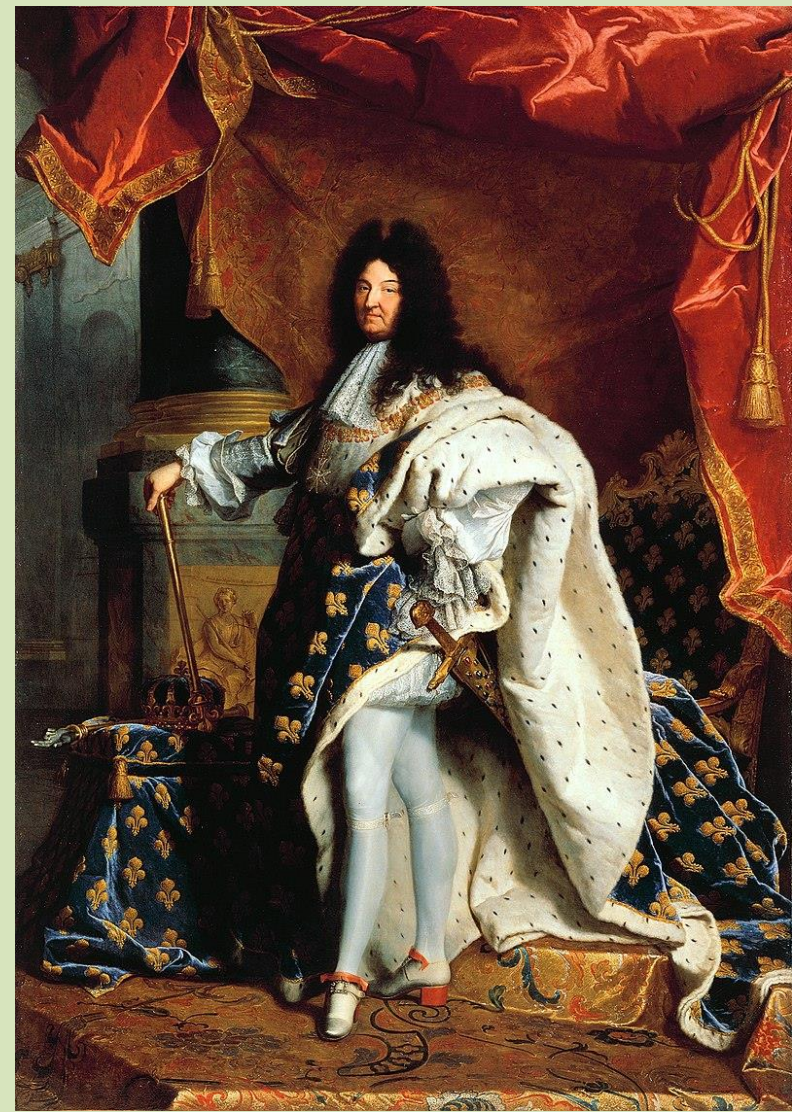
HYACINTHE RIGAUD: Louis XIV (Musée du Louvre)