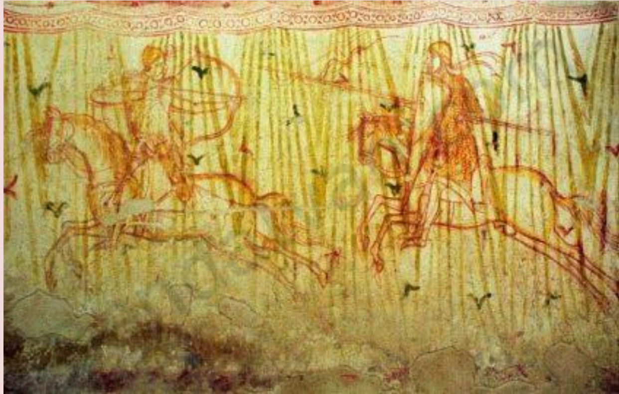
Az aquileiai bazilika altemplomának híres 10. sz.-i falfestménye: az itáliai kalandozások idejéből ábrázolt nyilazó magyar lovas – TK 123. o.