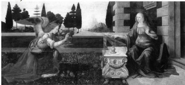
Leonardo da Vinci: Angyali üdvözlés (korabeli oltárkép) (A kép jobb oldalán Szűz Mária látható.)