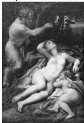
Antonio da Correggio: Zeusz és Antiópé (korabeli festmény)