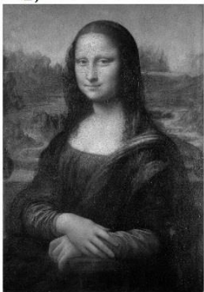
Leonardo da Vinci: Mona Lisa (korabeli festmény)

(Mona Lisa feltehetőleg egy firenzei polgár felesége volt.)